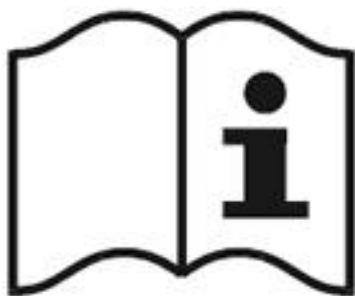
Рисунок 3 - Пиктограмма